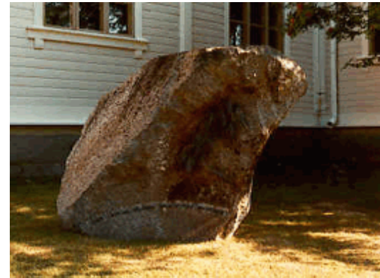
Nälkään kuolleiden muistomerkki kirkon vieressä.