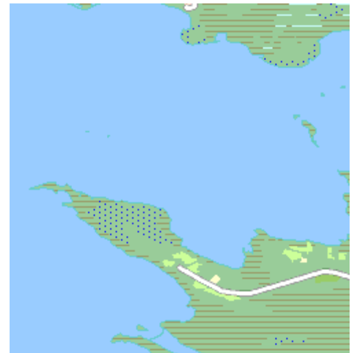
Liikasenniemi, Jongunjärven niemi

Kartalla mainittu Liikanen on talon (tai tilan) nimi, ja nimi tulee alkuperäisten asukkaiden mukaan. Se ei takaa sitä, että talossa asuisi juuri nyt henkilöitä, joiden sukunimi on Liikanen. (Esim. Pudasjärven Ojalan talo on mennyt jossakin vaiheessa vävylinjalle ja asukkaat lienevät nykyään Ruottisia. Talo on kuitenkin Ojala). Pudasjärven syrjäkylillä tiet on nimetty sen mukaan, mikä talo on tien päässä. Säkkinentie vie Säkkinen-nimisen talon pihaan ja Alatalonharjuntien päästä löytyy Alatalo jne.