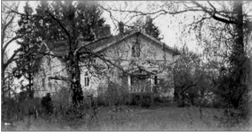
Kuhmalahden pappila, nykyisin Taidepappila.

tämä oli vastannut ”Pappi on suurin lahtari.” Tällöin punaiset vangitsivat isän ja samalla reissulla myös kansakoulunopettajan. Isä sairastui vakavasti ollessaan punaisten vankina, silloin äiti haki ja sai isän pois. Kansakoulunopettaja murhattiin.